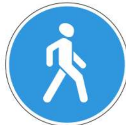
Знак 4.5.1 «Пешеходная дорожка»